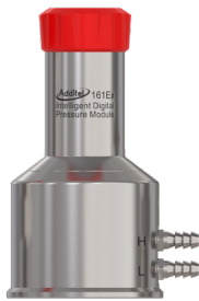
ADT161Ex 圧力モジュール - 詳細については、ADT161Ex データシートを参照してください。