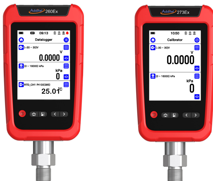
Additel 260Ex 及び 273Ex に ADT158 圧力モジュール装着