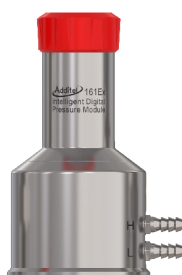
ADT161Ex 圧力モジュール - 詳細については、ADT161Ex データセットを参照してください。