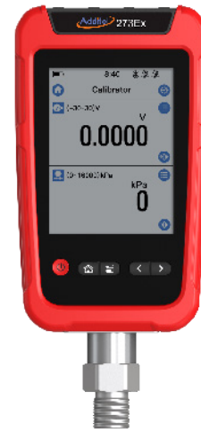
Additel 273Ex 本体と ADT158Ex モジュール