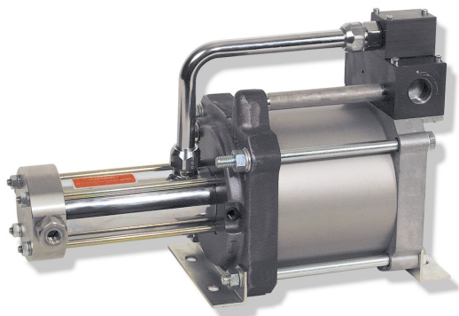
DLE 5-1 単動, シングルエアドライブヘッド 1 段式