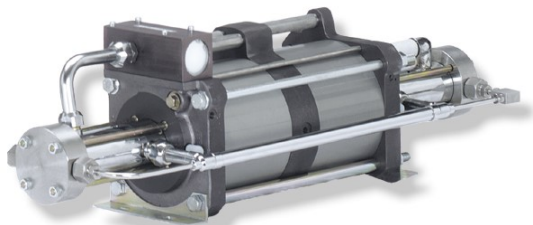
DLE 15-30-2 複動、ダブルエアドライブヘッド 2 段式