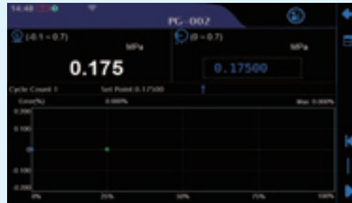
圧力ゲージ / 発信器 / スイッチ校正