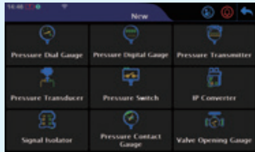
タスクマニュアル